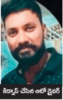
కిడ్నాప్ చేసిన ఆటో డ్రైవర్