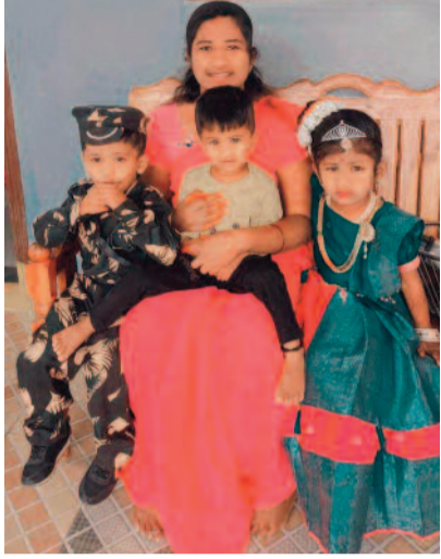
నా భార్య పిల్లల కనిపిస్తే చెప్పండి ఫ్లీట్!

కోడలు, పిల్లలతో జాడలేదని అత్త ఫిర్యాదు ఆటోడ్రైవర్ పై కుటుంబ సభ్యుల అనుమానం విషయం తెలుసుకొని బెహరన్ దేశం నుంచి వచ్చిన భర్త నెట్వర్క్ కు దొరకడం లేదని పోలీసుల ఉదాసీనత ఏడు రోజులుగా కనిపించని కుటుంబం కోరుట్లలో వివాహిత కిడ్నాప్ కలకలం