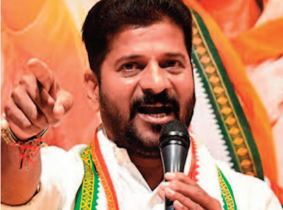
65.94 లక్షల ఎకరాల్లో పరిస్థానం కాగా, 144.8 లక్షల టన్నుల పంట ఉత్పత్తి అయ్యింది. ఈ ఏడాది 66.77 లక్షల ఎకరాల్లో పరి స్థానం చేయగా, 153 లక్షల టన్నుల పరిపంట ఉత్పత్తి జరిగినట్లు ప్రభుత్వం తెలిపింది. గ్రూప్ 3 అభ్యర్థులకు సీఎం విషెస్ తెలంగాణ వ్యాప్తంగా గ్రూప్ 3 పరీక్షలు రాసిన అభ్యర్థులకు సీఎం రేవంత్ రెడ్డి విషెస్ చెప్పారు. ఈ మేరకు ఎక్స్ వేదికగా పోస్ట్ చేశారు. 'ఈ రోజు గ్రూప్ -3 పరీక్షకు హాజరవుతున్న ఉ ద్యోగార్థులకు హృదయపూర్వక శుభాకాంక్షలు. ఈ పరీక్షలో మీరు విజయం సాధించి.. కొలువుల కలలను సాకారం చేసుకోవాలని మనస్ఫూర్తిగా కోరుకుంటున్నాను' అంటూ తెలిపారు.

బీఆర్ఎస్ తప్పు ప్రచారం పటాపంచలు తెలంగాణలో పరి దిగుబడి పెరగడంపై సీఎం రేవంత్ రెడ్డి హర్షం వ్యక్తం చేశారు. తెలంగాణ రైతుల ఘనత ఇది అని ప్రశంసలు కురిపించారు. కాళేశ్వరం వల్లే తెలంగాణలో పరిస్థానం పెరిగిందని బీఆర్ఎస్ చేసిన ప్రచారం తప్పుని తెలిపి యిందన్నారు. ఈ మేరకు ఆయన అదివారం ఎక్స్ వేదికగా పోస్ట్ పెట్టారు. కాళేశ్వరంలో భాగమైన మేడిగడ్డ కుంగి.. నీటిని నిల్వ చేసే పరిస్థితి లేకపోయి.. కాళేశ్వరం సరిహద్దు లేకుండా తెలంగాణ ఆవిర్భావం తర్వాత తొలిసారి రికార్డు స్థాయిలో పరిధాన్యం పండిందని ఆనందం వ్యక్తం చేశారు. రికార్డు స్థాయి వరి పంట దిగుబడి తెలంగాణ రైతుల ఘనత అని ముఖ్యమంత్రి అన్నారు. వారి క్రమ, చెమట, కష్టం ఫలితమని, తెలంగాణ రైతు దేశానికే గర్వకారణమన్నారు. ఈ ఘనత సాధించిన ప్రతి రైతు సోదరుడికి హృదయపూర్వక అభినందనలు అని ఆ పోస్ట్ లో పేర్కొన్నారు. కాగా, గతేడాది