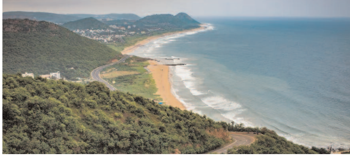
తీసుకుంటూ సందడి చేస్తున్నారు. గతంలోనూ ఇటువంటి సాధారణంగా మారింది. పున్నమికి, అమావాస్యకు ఇలా జరగడం పరిస్థితులు ఏర్పడినప్పటికీ.. వెనక్కి వెళ్లిన సముద్రం మళ్లీ సహజమే అంటున్నారని స్థానిక మత్స్యకారులు.

విశాఖపట్టణం, నవంబర్ 19 : విశాఖ తీరంలో సముద్రం సయ్యాట అడుతోంది. అలలతో ఉవ్వెత్తున ఎగసిపడుతూ ఉండే సముద్రం ఉన్నట్లుండి 200 మీటర్లు వెనక్కి వెళ్లింది. నిత్యం అలలు ఎగసిపడి బీచ్ రోడ్డును తాకేవి. అలాంటిది అలల తాకిడి లేకపోగా సముద్రం వెనక్కి వెళ్లిపోవడంతో స్థానికులు అశ్చర్యంతో పాటు భయాన్ని కూడా వ్యక్తం చేస్తున్నారు. వీటితో పాటు సముద్రంలో ఇసుక కోత కూడా ఓ కారణమని నేషనల్ ఇనిస్టిట్యూట్ ఆఫ్ ఓషన్ గ్రాఫీ సైంటిస్టులు అంటున్నారు. అయితే సముద్రంలో ఇలా మార్పులు వచ్చినప్పుడు సందర్భాలు అప్రమత్తంగా ఉండాలని సూచిస్తున్నారు. విశాఖ బీచ్ లో మారుతున్న కెరటాల అటుపోతూ, సాధారణ సమయంలో కనిపించని దృశ్యాలు కనిపిస్తున్నాయి. సముద్రం వెనక్కి వెళ్లిపోవడంతో తీరంలో రాళ్లు తేలి కనిపిస్తున్నాయి. కార్లకే పార్కింగ్ తర్వాత మళ్లీ కెరటాలు వెనక్కి వెళ్లినట్లు కనిపించాయి. ఆ తర్వాత రోజు కూడా అటువంటి దృశ్యాలు కనిపించాయి. ఇవి పర్యాటకులను తెగ ఆకర్షిస్తున్నాయి. బీచ్ కు వచ్చిన టూరిస్టులు, సరదాగా ఫోటోలు