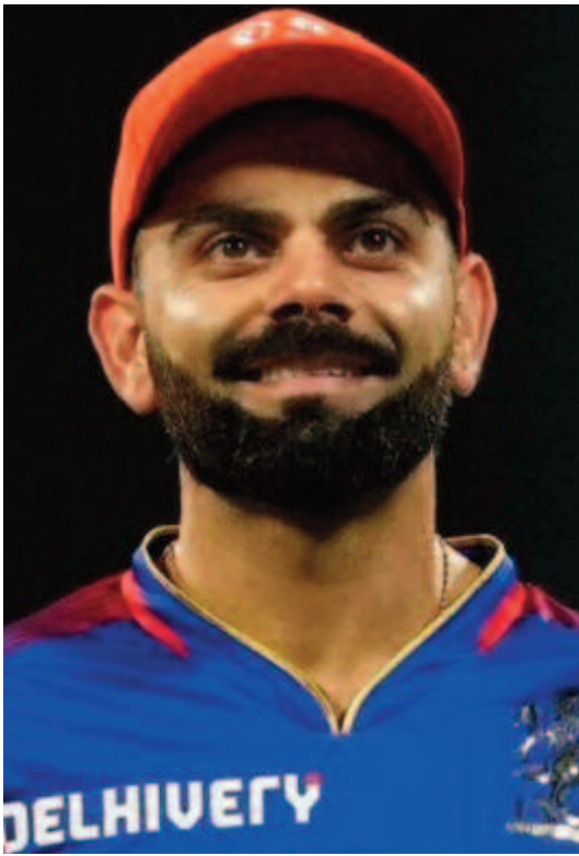
స్పిన్సర్ ఆరీసీబీ తరపున ఇప్పటికీ అత్యధిక వికెట్లు తీసిన బౌలర్ గా ఉన్నాడు. గతంలో ఎన్నో మ్యాచ్ లలో ఆరీసీబీ అద్భుత విజయాలను చహాల్ అందించాడు. ఐపీఎల్ 2025 వేలంలో చహాల్ కు భారీ ధర పలికే అవకాశం ఉంది. మరి ఏ జట్టు అతడిని సొంతం చేసుకుంటుందో చూడాలి.

నవంబర్ 24, 25 తేదీల్లో ఐపీఎల్ 2025 మేగా వేలం సౌదీ అరేబియాలోని జెడ్డలో జరగనుంది. వేలానికి ముందు రాయల్ ఛాలెంజర్స్ బెంగళూరు (ఆరీసీబీ) ముగ్గురు ఆటగాళ్లను మాత్రమే రిటైన్ చేసుకుంది. స్టార్ బ్యాటర్ విరాట్ కోహ్లీ (రూ. 21కోట్లు)ని టాప్ రిటెన్షన్ గా తీసుకోగా.. బ్యాటర్ రజత్ పాటిదార్ (రూ. 11కోట్లు), పేసర్ యశ్ దయాల్ (రూ. 5కోట్లు)ను అట్టిపెట్టుకుంది. ఫాఫ్ దుషేసిన్, గ్రేన్ మ్యాక్స్ వెల్, మహమ్మద్ సిరాజ్ లాంటి స్టార్ ఆటగాళ్లను వేలంలోకి వదిలేసింది. రూ. 83 కోట్ల పర్ఫెక్ట్ మంచి ఆటగాళ్లను కొనేందుకు ఆరీసీబీ సిద్దమైంది. ఆరీసీబీ కెప్టెన్ గా విరాట్ కోహ్లీ మరలా బాధ్యతలు చేపట్టే అవకాశం ఉన్నట్లు సోషల్ మీడియాలో ప్రచారం జరుగుతోంది. ఈ క్రమంలోనే బెంగళూరు వేలంపై స్టార్ స్పోర్ట్స్ షో 'గేమ్ ప్లాన్'లో టీమిండియా మాజీ క్రికెటర్, వ్యాఖ్యాత సంజయ్ మంజ్రేకర్ స్పందించాడు. ఆరీసీబీ కెప్టెన్ గా కోహ్లీ బాధ్యతలు స్వీకరిస్తే.. స్టార్ స్పోర్ట్స్ యుజ్సేంద్ చహాల్ ను తీసుకునేందుకు ప్రయత్నిస్తాడని తెలిపాడు. 'చహాల్ ను దక్కించుకోవడం ఆరీసీబీకి చాలా కష్టమని నేను అనుకుంటున్నా. ఎందుకంటే ఆర్ అశ్విన్, చహాల్ భాగస్వామ్యాన్ని కొనసాగించడానికి రాజస్థాన్ రాయల్స్ ప్రయత్నం చేస్తుంది. విరాట్ కెప్టెన్ అయితే పాత ట్రాప్ కార్డు చహాల్ ను తిరిగి జట్టులో చేర్చుకోవడానికి ప్రయత్నిస్తాడు. ఆరీసీబీ కెప్టెన్ గా కోహ్లీ వస్తే జట్టులో చాలా మార్పులు జరుగుతాయి' అని సంజయ్ అన్నాడు. ఐపీఎల్ 2024లో రాజస్థాన్ రాయల్స్ తరపున చహాల్ 15 ఇన్నింగ్స్ లో 9.41 ఎకానమీ రేటుతో 18 వికెట్లు తీశాడు. 160 ఐపీఎల్ మ్యాచ్ లలో యూజీ 205 వికెట్స్ పడగొట్టాడు. ఆరీసీబీ తరపున 112 ఇన్నింగ్స్ లో 7.58 ఎకానమీ రేటుతో 139 వికెట్స్ తీశాడు. ఈ లెగ్