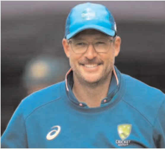
ఆస్ట్రేలియా నుండి ప్రకటన పెర్ట్ టెస్టుకు డేవియల్ వెట్టోరి తప్పకోవడం గురించి క్రికెట్ ఆస్ట్రేలియా ప్రతినిధి

ప్రస్తుతం భారత జట్టు ఆస్ట్రేలియా పర్యటనలో ఉంది. నవంబర్ 22 నుంచి ఇరు జట్ల మధ్య టెస్టు సిరీస్ ప్రారంభం కానుంది. ఈ సిరీస్ కు ముందు ఆస్ట్రేలియాకు గట్టి ఎదురుదెబ్బ తగిలింది. ఆస్ట్రేలియా ఆసిస్టెంట్ కోచ్ డేవియల్ వెట్టోరి పెర్ట్లో జరిగే మొదటి బోర్డర్-గవాస్కర్ ట్రోఫీ టెస్టు కు దూరం కానున్నాడు. బదులుగా ఐపీఎల్ 2025 మేగా వేలంలో పాల్గొనాలని నిర్ణయించుకున్నాడు. ఐపీఎల్లో సన్రైజర్స్ హైదరాబాద్ ప్రధాన కోచ్ గా కూడా డేవియల్ వెట్టోరి వ్యవహరిస్తున్నాడు. అయితే ఈ విషయాన్ని వెట్టోరి క్రికెట్ ఆస్ట్రేలియాకు తెలియజేశాడు. దీని తర్వాత వెట్టోరి ఇప్పుడు భారతదేశం- ఆస్ట్రేలియా మధ్య జరిగే మొదటి టెస్టు కోసం ఆస్ట్రేలియా జట్టు బాధ్యతను వదిలివేయనున్నాడు. జెడ్డలో జరగనున్న ఐపీఎల్ 2025 మేగా వేలంలో పాల్గొంటాడు. క్రికెట్