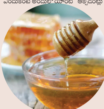
ఉంటాయి. అయితే, మీకు అధిక కొలెస్ట్రాల్ సమస్య ఉంటే, నిపుణుడిని సంప్రదించిన తర్వాత మాత్రమే మీ ఆహారంలో తేనెను తీసుకోవాలి. పేలవమైన జీర్ణకర్మి ఉన్నవారికి, తేనె దివ్యోషధం కంటే తక్కువ కాదు. కొద్దిగా తేనె తేడా కనిపిస్తుంది. చలికాలంలో ప్రతి రోజూ ఉదయం ఖాళీ కడుపుతో 1 స్పూన్ తేనె తింటే విషమం దో తొలిస్టి పాక్ అవుతాయి. తేనెలో యాంటీ ఇన్ఫ్లమేటరీ లక్షణాలు ఉన్నాయి. అటువంటి పరిస్థితిలో, ఖాళీ కడుపుతో ప్రతిరోజూ 1 టీస్పూన్ తేనె తినడం వల్ల దగ్గు నుండి ఉపశమనం పొందవచ్చు. తేనె తీసుకోవడం వల్ల రోగనిరోధక శక్తి పెరుగుతుంది. అనేక

వ్యాధులను నివారిస్తుంది. ఇది జలుబు, దగ్గును నివారించడంలో కూడా సహాయపడుతుంది. తేనెలో ఫ్రిబయోటిక్ లక్షణాలు ఉన్నాయి. ప్రతి రోజూ 1 టీస్పూన్ తేనె తినడం వల్ల శీతాకాలంలో జీర్ణ సమస్యల నుండి ఉపశమనం లభిస్తుంది. తేనెలో యాంటీ ఆక్సిడెంట్, యాంటీ బ్యాక్టీరియల్ లక్షణాలు ఉన్నాయి. అటువంటి పరిస్థితిలో, శీతాకాలంలో తేనె తినడం రోగనిరోధక శక్తిని బలపరుస్తుంది. మీరు ఒక చింతా తేనెలో పసుపు, కొద్దిగా అల్లం రసం తీసుకుంటే ఎన్నో ప్రయోజనాలు అందవచ్చు. సునని ఆరోగ్య నిపుణులు చెబుతున్నారు. మీరు శీతాకాలంలో తేనెను తీసుకుంటే, మీ గుండె చాలా కాలం పాటు ఆరోగ్యంగా ఉంటుంది.