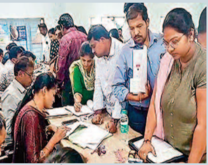
నిర్దిష్ట లేకుండా, ప్రకటనల ద్వారా గందరగోళాన్ని సృష్టిస్తున్నారని అభ్యర్థులు విమర్శించారు.

వారధి న్యూస్, హైదరాబాద్ : తెలంగాణ డిఎస్పీ 2024 ఉపాధ్యాయ పోస్టింగ్ కౌన్సిలింగ్ పై విద్యా శాఖ చేసిన ప్రకటనలు గందరగోళానికి దారితీశాయి. ఉదయం, కౌన్సిలింగ్ ను సాంకేతిక సమస్యల కారణంగా వాయిదా వేసినట్లు ప్రకటించిన విద్యా శాఖ, గంట ముందే సాంకేతిక సమస్య పరిష్కారమైందని, మధ్యాహ్నం 2 గంటలకు కౌన్సిలింగ్ ను ప్రారంభిస్తామని ప్రకటించింది. విద్యా శాఖ మంత్రి అందుబాటులో లేని సమయంలో ఈ విధమైన ప్రతికూల ప్రకటనలు చేయడం అభ్యర్థుల్లో ఆందోళనను కలిగించింది.