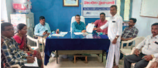
ఆయన ప్రాథమిక పనులు ఆలస్యంవుతున్నాయి. ఎంపీడి వో కూడా ఈ కార్యక్రమంలో పాల్గొనడంతో అభివృద్ధి కార్యక్రమాలపై దృష్టి సారించడం అసాధ్యంగా మారింది. గ్రామపంచాయతీ కార్యదర్శులను కార్యక్రమంలో భాగస్వాములుగా తీసుకుంటుండడం వల్ల వారికి తమ కేటాయింపిన గ్రామాల్లో విధులకు హాజరుకావడం కష్టమవుతోంది. సెలవు రోజు ఉన్న ఆదివారం, వార గ్రామాల వైపు చూడడం లేదు. ఇలాంటి పరిస్థితులు, ప్రభుత్వ అక్షయాలను వ్యతిరేకంగా తీసుకువస్తున్నాయి. కార్యక్రమాన్ని ఆదివారం స్థానిక సమయానికి నిర్వహించడం వల్ల, అధికారుల పనితీరుకు చెక్ పడే అవకాశం ఉంది. ప్రభుత్వం ఈ కార్యక్రమం పునరాలోచన చేసుకోవాలని అవసరం ఉన్నది, తద్వారా వృధా సమయాన్ని నివారించడంతో పాటు అభివృద్ధి కార్యక్రమాలను సమర్థవంతంగా కొనసాగించవచ్చు.

వారధి న్యూస్, మహబూబ్ నగర్: సహజ పేటలో జిల్లా కలెక్టర్ విజయేందర్ టోయ్ ఆదేశాల మేరకు నిర్వహిస్తున్న మండల ప్రజావాణి కార్యక్రమానికి నామమాత్రపు స్పందన మాత్రమే లభిస్తోంది. గత మూడు వారాలుగా, మండల ఉన్నతాధికారులు, అన్ని శాఖల అధికారులు, గ్రామపంచాయతీ కార్యదర్శులు పాల్గొనున్న ఈ కార్యక్రమంలో ప్రజలు ఫిర్యాదులు చేయడంలో ఆసక్తి చూపించడం లేదు. ప్రజలకు ప్రజావాణి కార్యక్రమం గురించి అవగాహన లేకపోవడం, సంబంధిత అధికారులు గ్రామాల్లో చాటింపు ఏర్పాటు చేయకుండా ఉండటం ప్రధాన కారణం. ప్రజలు తమ సమస్యల గురించి సమగ్ర అవగాహన పెంపొందించే పరక, ఈ కార్యక్రమంలో ఫిర్యాదులు మరింత మెరుగుపడే అవకాశం లేదు. ఈ కార్యక్రమంలో మండల మేజిస్ట్రేట్ అయిన తహసీల్దార్ తపస్వినీరాణి పాల్గొనాలి వున్నందున,