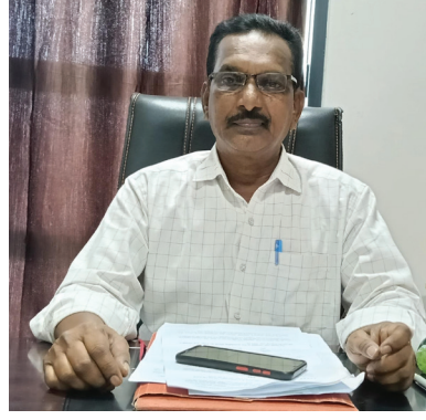
డాక్టర్ అప్పేట్ చేయాలన్నారు. మూడో దశలో గతంలో మాదిరిగా వేతనాల వివరాలను పూర్తిగా నింపి, దరఖాస్తులు నమోదుచేయాలన్నారు.