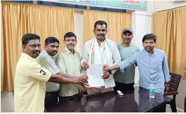
ఆదర్శ పాఠశాలలో సమస్యల పరిష్కారానికై