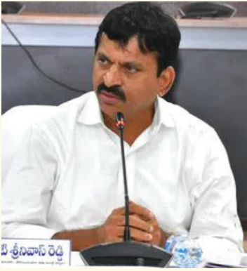
డిసెంబర్ నాటికి అర్హులైన పేదలకు ప్రభుత్వ భూములు పంచుతామని కీలక ప్రకటన చేశారు.