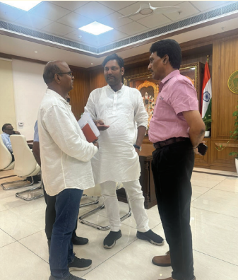
అనిరుద్ రెడ్డి ఈ ఆంశాన్ని సీరియస్ గా తీసుకుని, హైవే అధికారులతో కలిసి వెంటనే చర్యలు తీసుకునేలా చేశారని తెలిపారు. హైవే అధికారులు ఈ రోడ్డులో బీటీ రోడ్డు వేయడానికి 30 రోజుల్లో చర్యలు తీసుకుంటామని హామీ ఇచ్చారు.

వారధి న్యూస్, మహబూబ్ నగర్: జడ్చర్ల పట్టణం లో సిగ్నల్ గడ్డ రోడ్డు సమస్య త్వరలో పరిష్కారం కానుందని జడ్చర్ల ఎమ్మెల్యే జనపల్లి అనిరుద్ రెడ్డి తెలిపారు. నేషనల్ హైవే నెంబర్ 167 నిర్మాణంలో రోడ్డు పనులు కాంట్రాక్టర్ నిర్లక్ష్యం, రైల్వే శాఖ డియరెన్స్ లు లేటవడం వంటి కారణాలతో నిలిచిపోయి, తీవ్ర అసౌకర్యం కలిగించాయి. ఈ రోడ్డు దుస్థితిని నేషనల్ హైవే అథారిటీకి ఫిర్యాదు చేసిన ఎమ్మెల్యే, రోడ్డు నిర్మాణం 30 రోజుల్లో పూర్తి చేస్తామని హామీ పొందారు. సిగ్నల్ గడ్డ ఏర్పడడంతో ప్రజలకు రాకపోకలు కష్టతరం అవుతున్నాయి. గతంలో కూడా ప్రజల ఫిర్యాదు చేసి నప్పటికీ, ఈ సమస్యను ఎటువంటి పరిష్కారం రాలేదని విమర్శలు ఉన్నాయి. కొత్తగా ఎన్నికైన