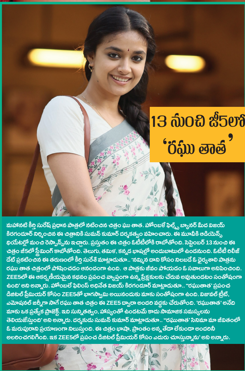
13 నుంచి జీ5లో 'రఘు తాత'