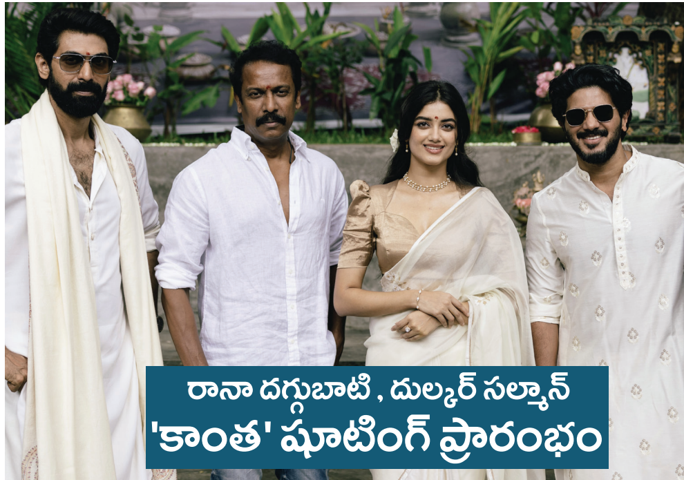
రానా దగ్గుబాటి, దుల్కర్ సల్మాన్ 'కాంత' షూటింగ్ ప్రారంభం