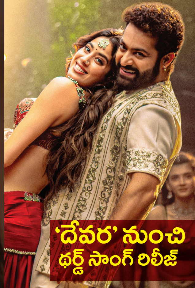
'దేవర' నుంచి థర్డ్ సాంగ్ రిలీజ్